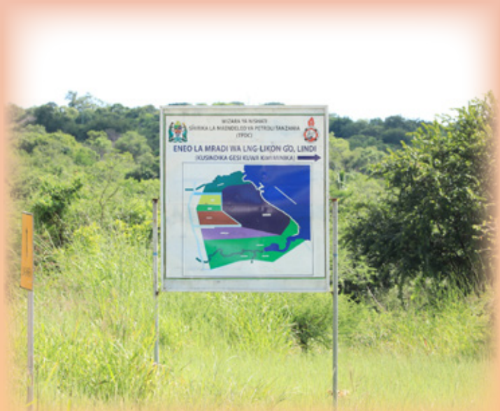
Muonekano wa sasa wa eneo litakalojengwa mradi wa kusindika gesi asilia (LNG) lililopo Likong'o Mkoani Lindi.