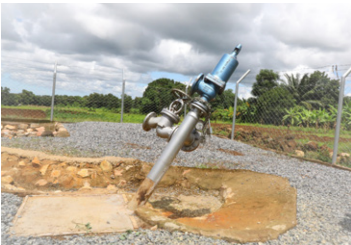
Kisima kifupi cha utafiti cha Jotoardhi kilichochoorongwa katika eneo la Kiejo-Mbaka wilayani Rungwe mkoani Mbeya.

Alisema Katibu Mkuu Alisema kuwa, nchi ya Kenya ina zaidi ya megawati 1100 zinazotokana na Jotoardhi na Tanzania kutokana na eneo lake kubwa kupitiwa na Bonde la Ufa kuna uwezekano wa kupata umeme mwingi zaidi